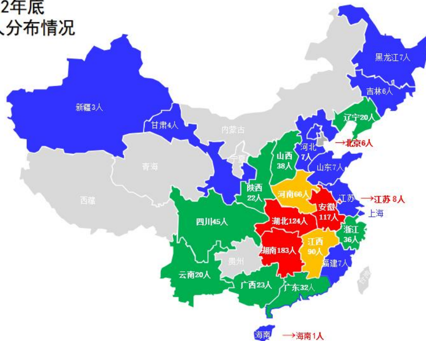
截止2022年底 行善者873人分布情况

2.2 受益人概况：行善者 873 人（含 2022 年过世的 12 位），分布在 23 个省市。详见下图。